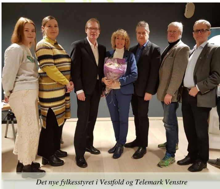
Det nye fylkesstyret i Vestfold og Telemark Venstre